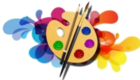
PEINTURE & DESSIN