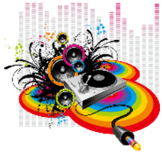
KIDS MIX CLUB